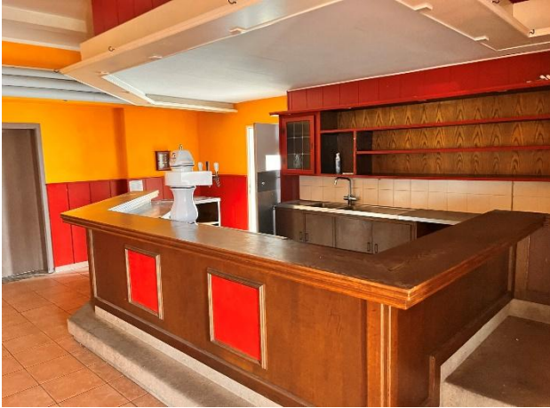
Tresenbereich vor geplantem Umbau