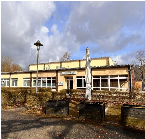
Gaststätte nebst Außengelände